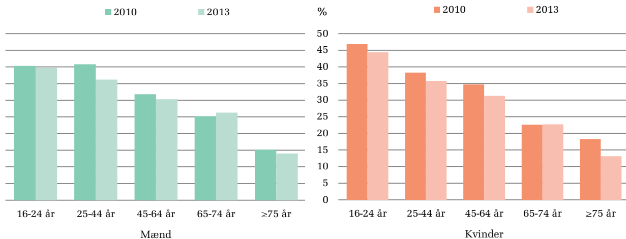
Figur 2. Andel, der i boligen har været generet af nabostøj inden for de seneste 14 dage, blandt personer der bor i lejlighed. 2010-2013. Procent

Udvikling: Fra 2010 til 2013 ses et fald i andelen, der har været generet af nabostøj inden for de seneste 14 dage. Udviklingen i de enkelte køns- og aldersgrupper viser dog et noget usystematisk billede.